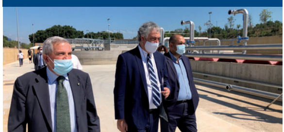
INAUGURAZIONE DEL DEPURATORE CONSORTILE CON L'ASSESSORE ALLO SVILUPPO ECONOMICO, COMMERCIO E ARTIGIANATO, RICERCA, START-UP E INNOVAZIONE DELLA REGIONE LAZIO, PAOLO ORNELI